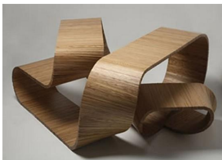
صورة " 10 " تصميم يوضح مفهوم طاولة وكرسي في قطعة واحدة من الأثاث " قطعة اللا نهائية " توضح ما بها من الديناميكية - تصميم كريم رشيد.

ويتضح من تصميم الأثاث الديناميكي للبنية الفراغية، حيث عمارة المستقبل، انه البنية ذات الأبعاد المتعددة، حيث يختفي مفهوم الأثاث التقليدي، ليصبح ذاتا في كيانا عضويا واحدا، انه الفضاء الافتراضي في كتلة او مسطح تجريبي، والواقع داخل فكرتها ومضمونها انه الأشكال المجردة التي تطفو وتتماهي في لحن أبدي معبرة عن قوة وحضور الابداع الذاتي. دائما ما تنعكس أفكار الفنان الفلسفية على انتاجه الفني، والفلسفة النظرية، دائما ما تصنع أفكارا واقعية، تترجم الي أشكال عينية محسوسة، من هنا تتجلى أهمية الحوار الإبداعي في تصميم جماليات التصميم الداخلي.